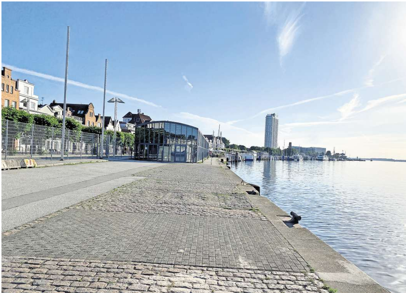
Der Blick Richtung Travemündung: Hier am Travemünder Ostpreußenkai hätte die „MS Europa“ festmachen sollen.