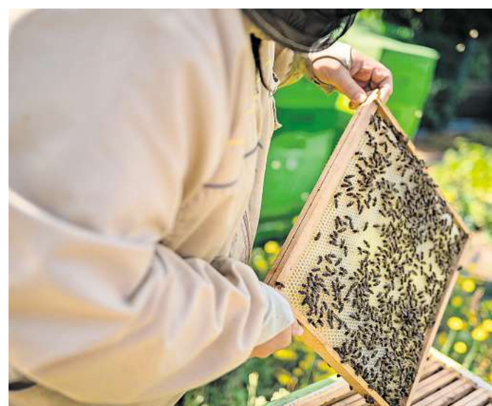
Vorsichtig muss der Imker mit den Waben umgehen.