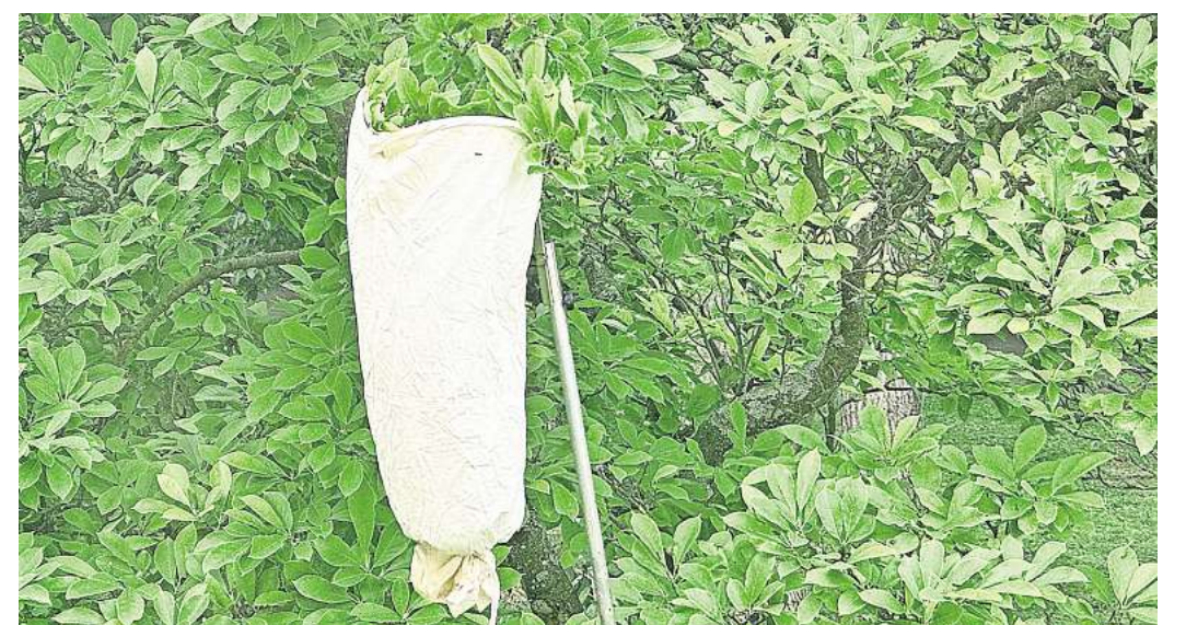
Mit diesem übergroßen Apfelpflücker hat Philipp Werner die Bienen eingesammelt.