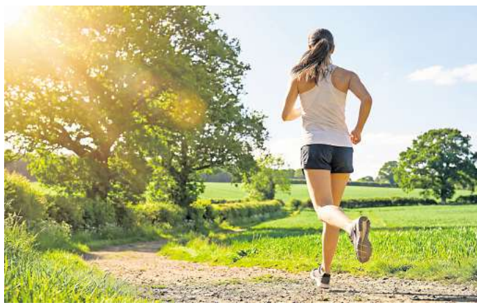
Wer im Sommer bei großer Hitze Sport treibt, sollte einiges beachten, ansonsten könnte es zu großen gesundheitlichen Problemen kommen.

Steigt die Temperatur, schlägt das Herz schneller – bei Hitze bis zu 20 Schlägen mehr in der Minute als an kühlen Tagen. Deshalb sollte die Intensität reduziert werden: Training am Limit ist zu vermeiden.