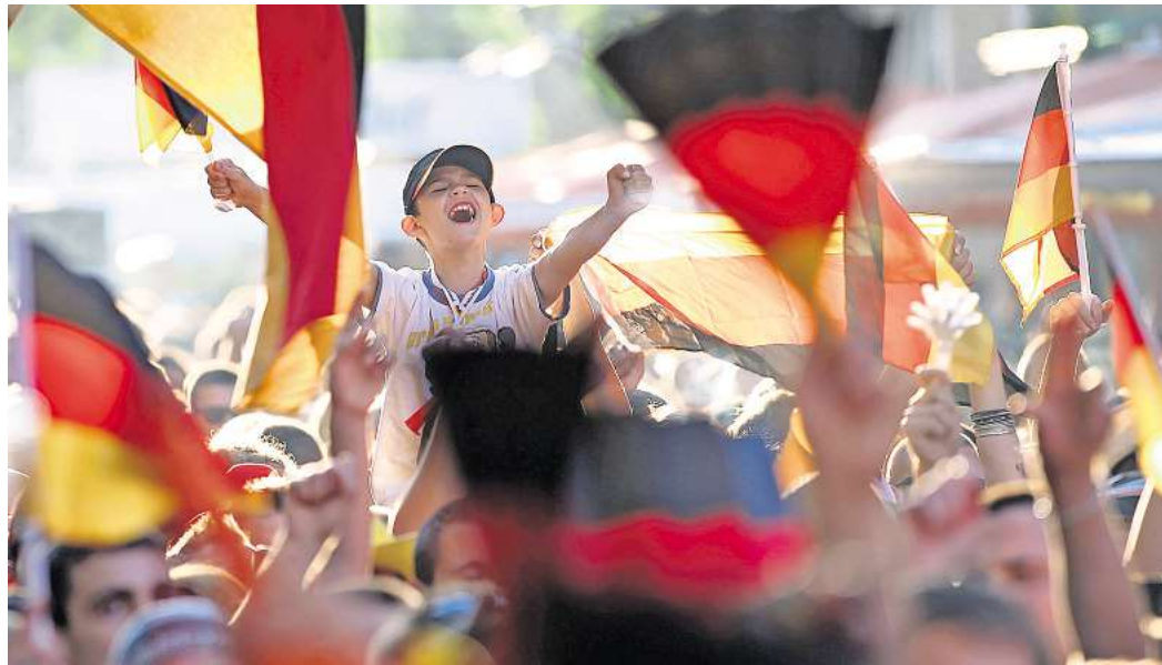
Jubelstimmung in Ostholstein und Lübeck: Zur Fußball-WM gibt es viele Angebote, um gemeinsam mit vielen anderen die Spiele der DFB-Elf an großen Leinwänden zu verfolgen.

Wegen der späten Spielzeiten wird es im Kurpark von Scharbeutz kein Public Viewing geben. Public Viewing, und zwar mit Meerblick, gibt es dafür aber in der Zeitlos Bar in Haffkrug. Dort werden die Deutschland-Spiele auf großer Leinwand übertragen. Im Café Grande in Scharbeutz werden alle Spiele