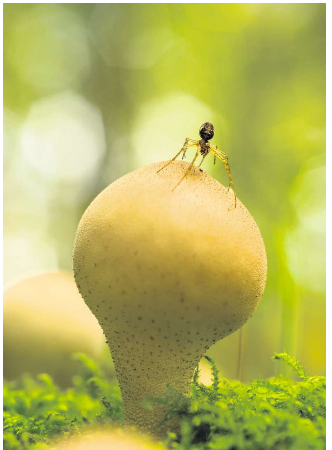
Viele oft übersehene Organismen wie beispielsweise der Birnenstäubling stehen bei den Lübecker Aktionstagen „Artenvielfalt erleben“ im Mittelpunkt.

Das komplette Programm gibt es im Internet unter www.museum-fuer-natur-und-umwelt.de