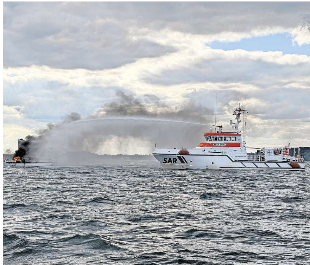
Der Seenotrettungskreuzer „FELIX SAND“ im Einsatz für eine brennende Segelyacht in der Lübecker Bucht: Auch dieser Einsatz ist in der ARD-Serie „Die Seenotretter“ zu sehen.

Auch in der von der DGzRS betriebenen deutschen Rettungsleitstelle See, dem Maritime Rescue Co-ordination Centre (MRCC) Bremen, soll erneut gedreht werden. MRCC Bremen ist zuständig dafür, sämtliche Such- und Rettungsmaßnahmen in den deutschen Gebieten von Nord- und Ostsee zu koordinieren.