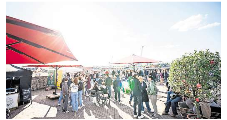
Die Dachterrasse des EHM lädt während des Hanse-KulturFestivals mit kühlen Getränken in entspannter Atmosphäre zum Verweilen ein.

besonderes Finale das Lohmühlenstadion mit einem Abschlussgottesdienst unter den Veranstaltungsorten. Das Programm und weitere Informationen gibt es im Internet auf der Seite www.kirchenmusikfest2026.de