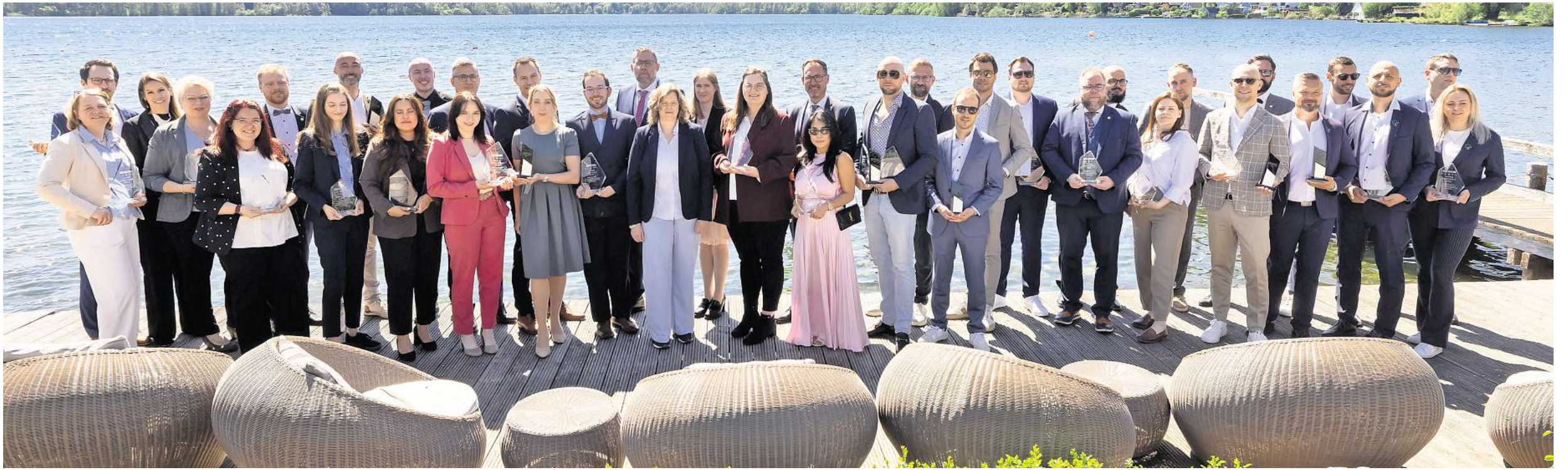
Schmelzer Hörsysteme wurde mit dem „The Secret Hearing Expert Award“ und dem „The Secret Unternehmer Award“ ausgezeichnet.