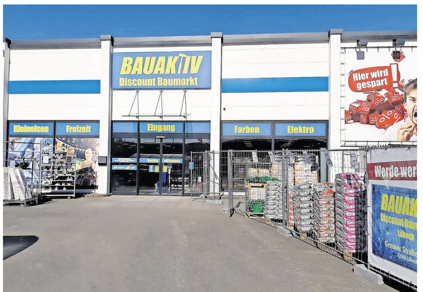
Der Baumarkt-Discounter Bauaktiv in Lübeck-Genin schließt am 30. Juni endgültig seine Türen.