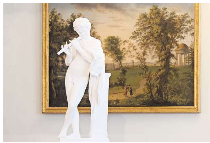
Die Sonderausstellung „Im Spiegel der Antike“ im Schloss Eutin ist morgen kostenfrei zu entdecken.