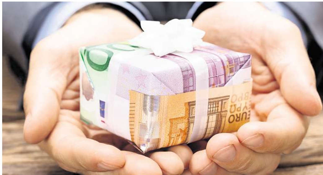
Wer sein Vermögen schon zu Lebzeiten weitergeben will, muss einiges beachten.

Liegt der Immobilienwert unter 400.000 Euro, fällt für die Kinder keine Schenkungsteuer an. Ist die Immobilie wertvoller, können zwei Teilschenkungen im