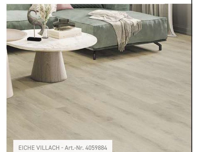
EICHE VILLACH - Art.-Nr. 4059884

KNUTZEN HOME Lübeck Osterweide 14 Telefon 0451 50 49 060