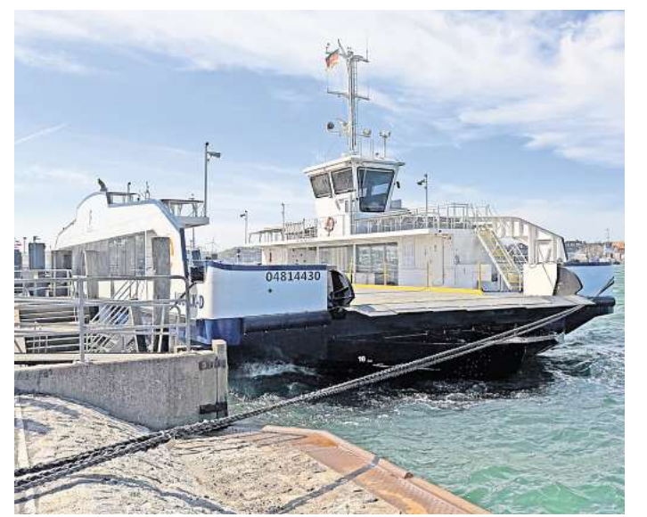
Still ruht die Fähre: Die „Welt ahoi!“ liegt nach wie vor an einem Anleger auf der Priwallseite.

Danach gab es immer wieder Versuche, die Fähre im Echbetrieb einzusetzen, was gelegentlich sogar über mehrere Tage gelang. Doch die „Welt ahoi!“ dümpelte meistens fest vertaut an einem Anleger – entweder auf