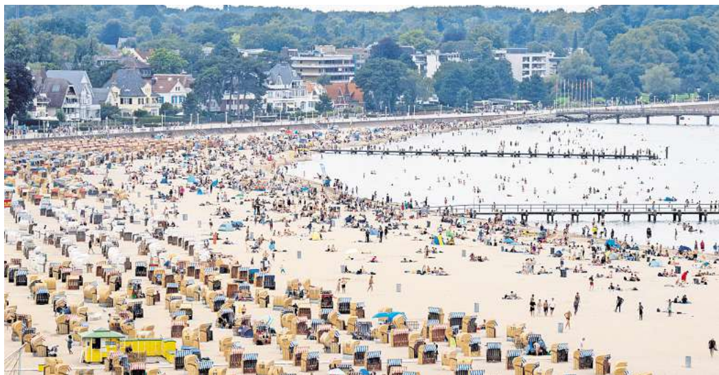
Tagesgäste und Urlauber müssen ab diesem Sommer in Travemünde mehr bezahlen. 3,50 Euro werden in der Hauptsaison pro Tag fällig.

Die Lübecker Bürgerschaft hat einstimmig der Erhaltungsstrategie Fahrbahnen zugestimmt. Ab 2027 will die Lübecker Stadtverwaltung zwölf Millionen Euro pro Jahr für Sanierungen investieren. Dieser Betrag sei notwendig, um den Verfall der Straßen aufzuhalten und abzubauen. Als mögliche Maßnahmen für die kommenden Jahre nennt die Stadt Kronsforder Allee, Facken-