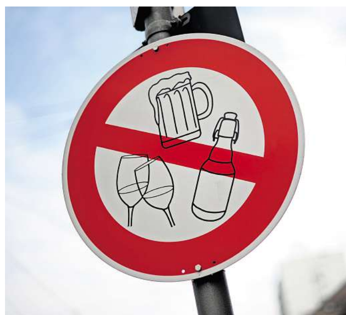
In vielen Städten gibt es Alkoholverbotszonen. Lübeck sollte dem Beispiel folgen, findet die Junge Union.