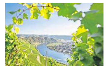
Grandioser Panoramablick an der Mosel.