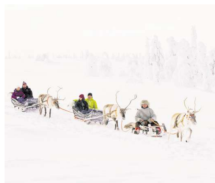
Eine Hundeschlittenfahrt ist eines der Erlebnisse, die auf die Teilnehmenden der Reise wartet.