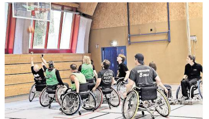
Beim HANSOLU-Ostseepokal spielen Rollstuhlfahrende und Fußgänger gemeinsam Rollstuhl-Basketball.

Neben dem sportlichen Erlebnis bietet der Ostseepokal weit mehr als nur ein Sportturnier. Er ist ein Tag voller Bewegung, Begegnung und echter Teammomente und bietet die Chance,