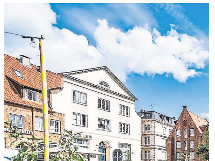
Der Sommergarten vor dem Heiligen-Geist-Hospital: ein Labyrinth aus vielen bunten Hochbeeten auf dem Koberg in der Lübecker Innenstadt.

Mit rund 200 Hochbeeten, Sitzgelegenheiten und frei zugänglichen Aufenthaltsflächen steht der Lübecker Sommergarten für urbane Lebensqualität mitten in der Altstadt. Das Projekt verbindet Klimaschutz, Biodiversität und soziale Begegnung – kostenlos, barrierearm und für alle Generationen zugänglich. Die wachsende Zahl an Unterstützenden zeigt, dass nachhaltige Stadtentwicklung eine Gemeinschaftsaufgabe ist. Unternehmen und Organisationen engagieren sich dabei nicht nur finanziell, sondern setzen zugleich ein sichtbares Zeichen für Verantwortung gegenüber Stadt und Gesellschaft. Wer mehr über den Sommergarten erfahren möchte, findet unter www.luebeck-tourismus.de/kultur/sommergarten alles Wissenswerte.