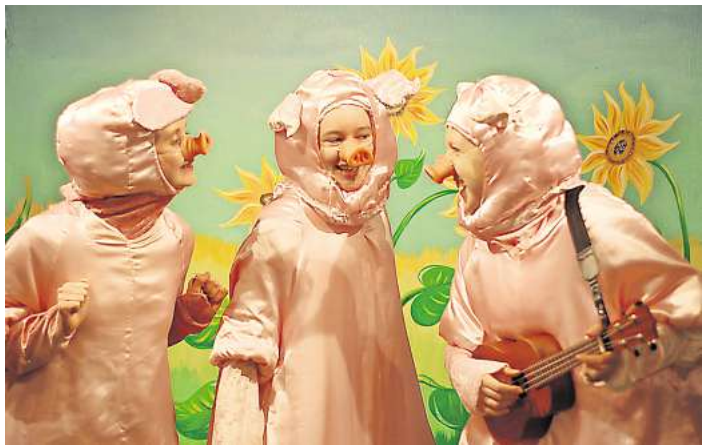
Die drei kleinen Schweinchen sind heute im Theater am Tremser Teich zu sehen.