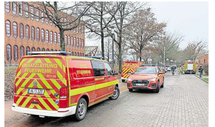
In der Emil-Possehl-Schule im Stadtteil St. Lorenz wurde Reizgas versprüht.

„Insgesamt sind drei Menschen als leicht verletzt eingestuft worden“, erklärte Gerlach.