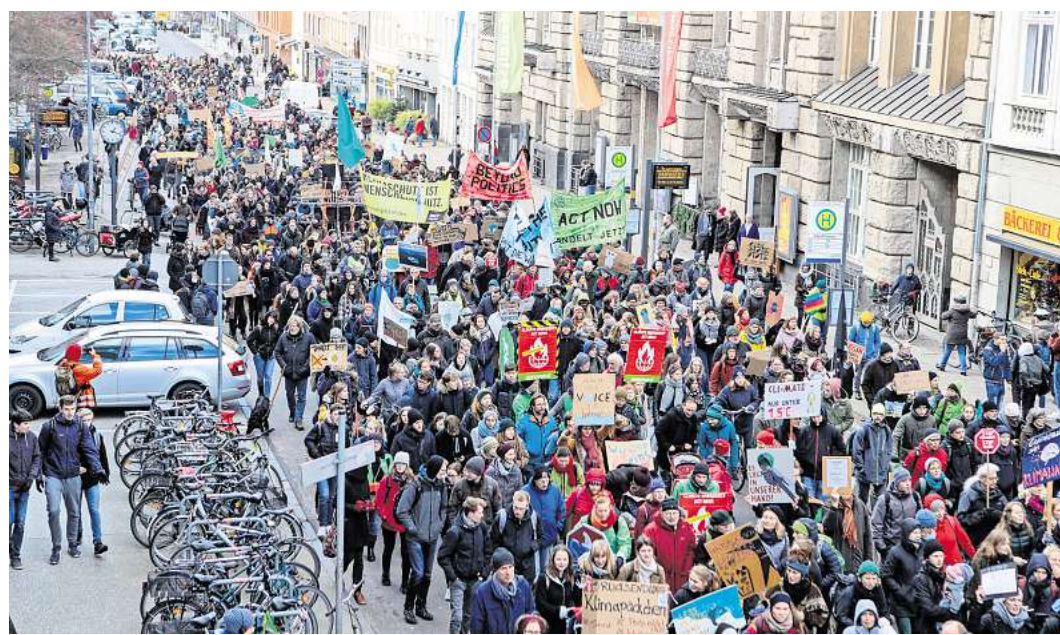
Die Zeiten, als Klimaschutz noch viele Bürger mobilisierte – hier eine Demo von Fridays for Future in Lübeck Anfang 2022 – sind auch in der Hansestadt vorbei.

Wie stehen die Deutschen zum Klimaschutz? Das haben in diesem Jahr mehrere Studien abgefragt – mit teils widersprüchlichen Ergebnissen. Das Forschungsinstitut Gesellschaftlicher Zusammenhalt (FGZ) hat vor kurzem eine deutschlandweite, repräsentative Längsschnittstudie mit mehr als 8000 Befragten vorgelegt. Danach lehnen acht Prozent Klimaschutzmaßnahmen