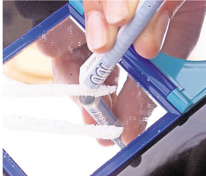
Im vergangenen Jahr informierten sich pro Tag knapp 16 000 Menschen zu Amphetaminen und Kokain.

Über Drogen aufklären: Nicht erst, wenn eine Sucht entsteht: Seit 2001 bietet das Online-Portal Ratsuchenden eine unkomplizierte Möglichkeit, professionelle Beratung zu erhalten – anonym, vertraulich und ohne erhobene moralischen Zeigefinger. Geschulte Beraterinnen und Berater sind über Telefon, E-Mail und Chat erreichbar und stehen für Fragen zur Verfügung. Im Jahr 2024 standen vor allem Fragen zu Abhängigkeit und Therapieoptionen im Fokus. Auch Angehörige, die sich um eine betroffene Person sorgen, griffen verstärkt auf das Beratungsangebot zurück. In den meisten Fällen drehten sich die Beratungen um