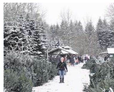
Der Bliestorfer Wald-Weihnachtsmarkt hat an drei Wochenenden geöffnet.

Bliestorfer Wald-Weihnachtsmarkt Forst Bliestorf Schenkenberger Weg, 23847 Bliestorf