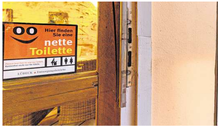
32 Mal gibt es die „Nette Toilette“ in Lübeck und Travemünde, auch hier im Café Calma in Lübeck an der Huxstraße.

Erkennbar sind die teilnehmenden Gastronomen durch einen roten Aufkleber mit dem