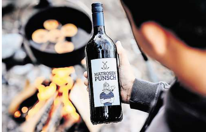
Geschmack des Nordens: Der Matrosenpunsch ist ein besonderes Geschenk.

Mit viel Liebe, Sorgfalt und hochwertigen Zutaten wird der Matrosenpunsch direkt in Lübeck entwickelt, produziert und abgefüllt – ganz ohne künstliche Zusätze. Für die Fangfrisch-Crew zählen echtes Handwerk, Frische und Regionalität – das schmeckt man in jedem Schluck.