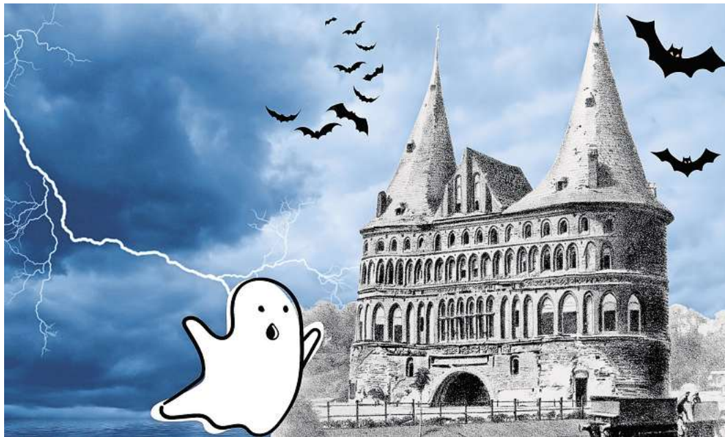
Das Holstentor verwandelt sich zu Halloween in einen Ort voller Schauer und Spannung. Für Familien gibt es ein abwechslungsreiches Programm. Grafik: Lübecker Museen

Weitere Informationen rund um den Führerscheintausch: luebeck.de/alten-fuehrerschein-in-neuen-umtauschen .