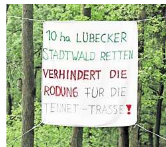
Seit Monaten kämpfen Bürger und Initiativen für den Erhalt des Bartelsholzes im Lübecker Stadtwald.

Unterstützung kommt von einer großen Mehrheit der Bürgerschaft, die sich für eine alternative Trassenführung im Rahmen des Planfeststellungsverfahrens ausgesprochen hat. Die alternative Trasse dürfe nicht durch den Lübecker Stadtwald geführt werden. „Die Landesregierung und die Planfeststellungsbehörde werden gebeten, einen entsprechenden Plan zu prüfen und vorzulegen“, lautete der Beschluss der Bürgerschaft.