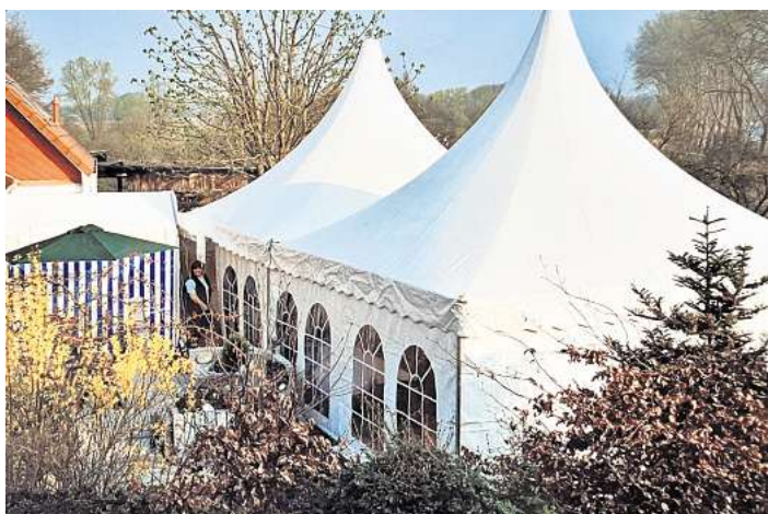
Für kleinere Anlässe verleiht Zelt-König solche schmucken Pagodenzelte, auf Wunsch mit dem gesamten Party-Equipment.