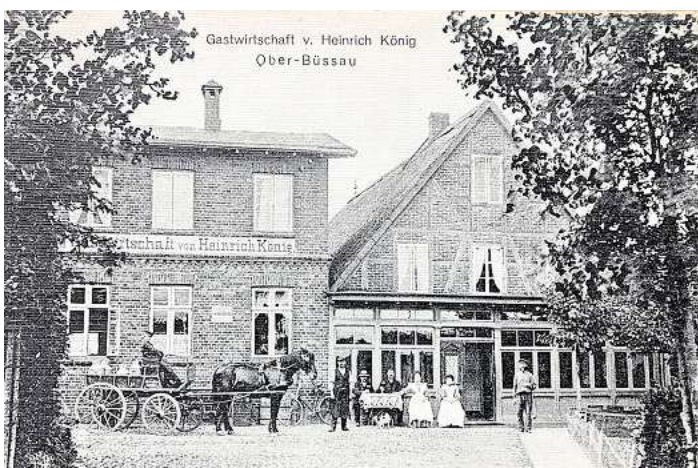
Postkarte von 1920: Aus einer Wartehalle bei der einstigen Schmiede entstand über die Jahre die Gastwirtschaft König.