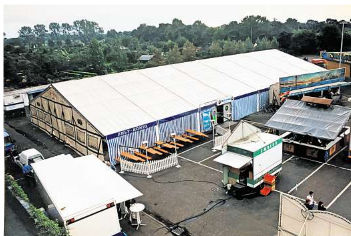
Die Festzelte von Zelt-König mit bis zu 1200 Quadratmetern Fläche sind bei den Großveranstaltungen der Region nicht wegzudenken.