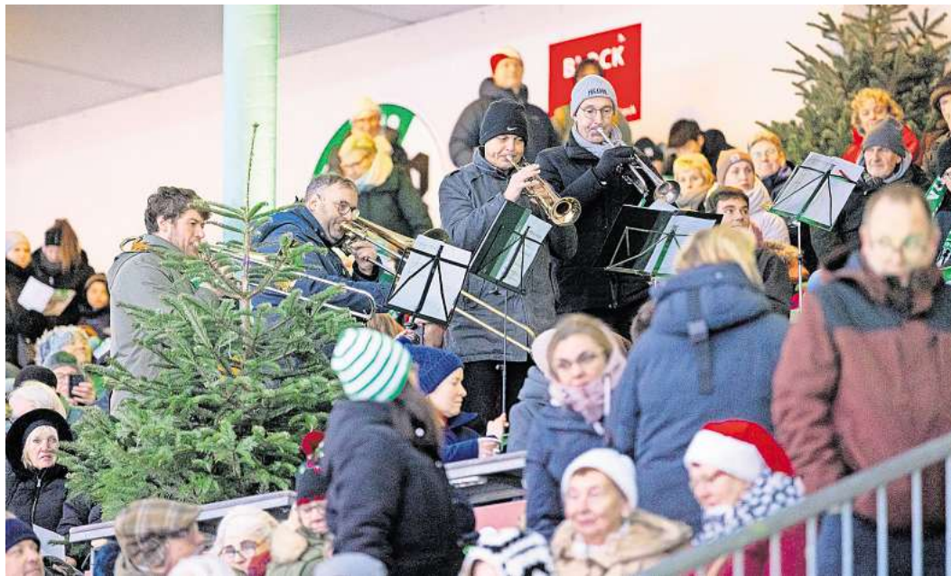
Im VfB-Stadion wird am 1. Advent nicht gekickt, sondern gesungen