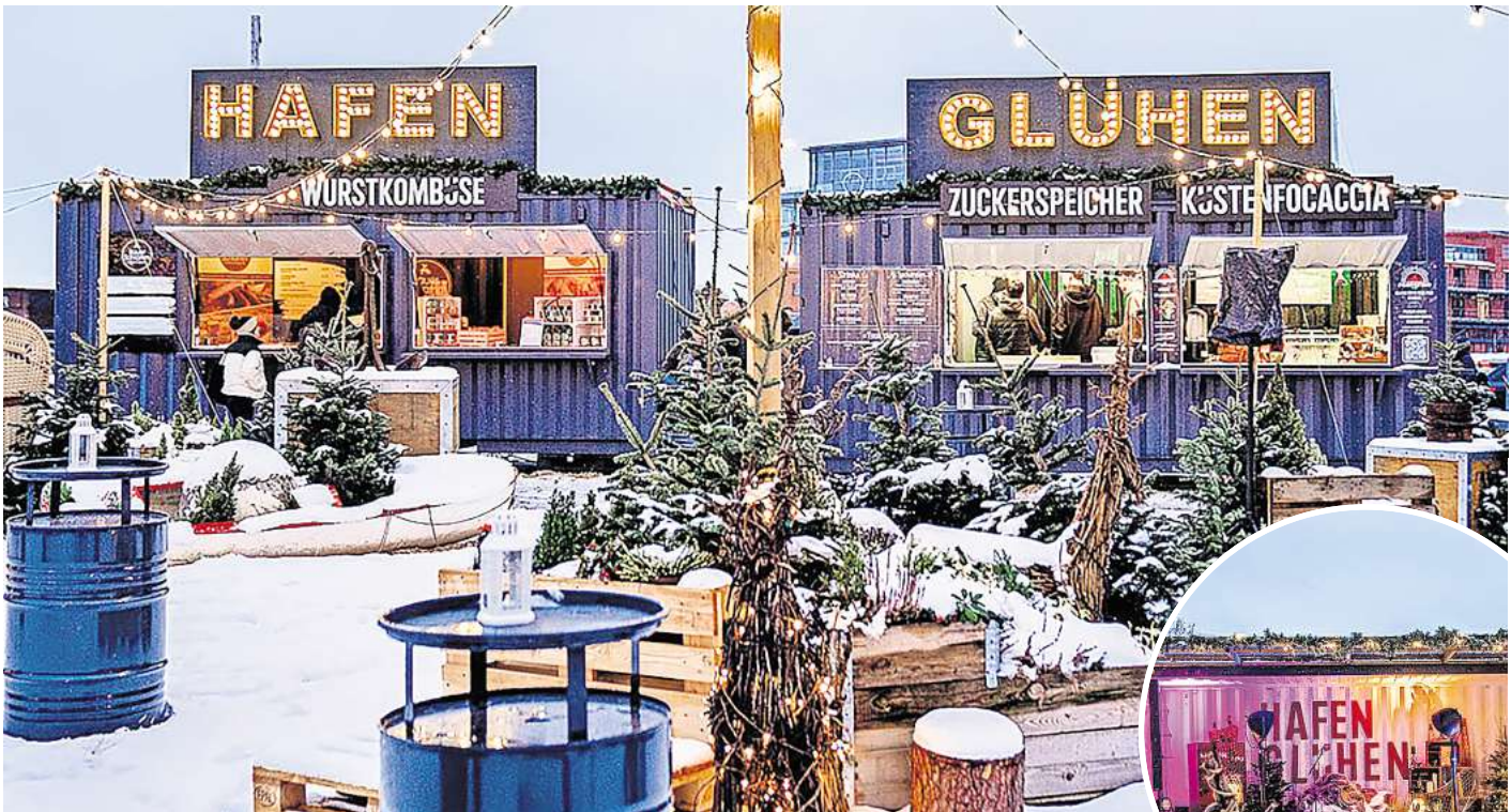
Das Hafenglühen direkt am Drehbrückenplatz erfreut sich großer Beliebtheit.