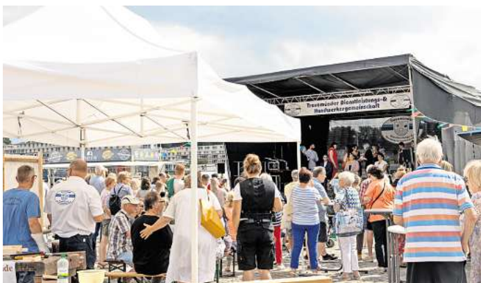
Die TDHG lädt zum Handwerkerfest auf den Wochenmarktplatz vor der Priwallfähre ein.

der Bühne. Am Freitag spielt von 19 bis 23 Uhr das Duo Hit Skip, das dem Publikum in bewährter Weise kräftig einheizen wird. Der Sonnabend wird ab 19 Uhr von der Band CopyShop aus Hamburg bestritten, die auf der Büh-