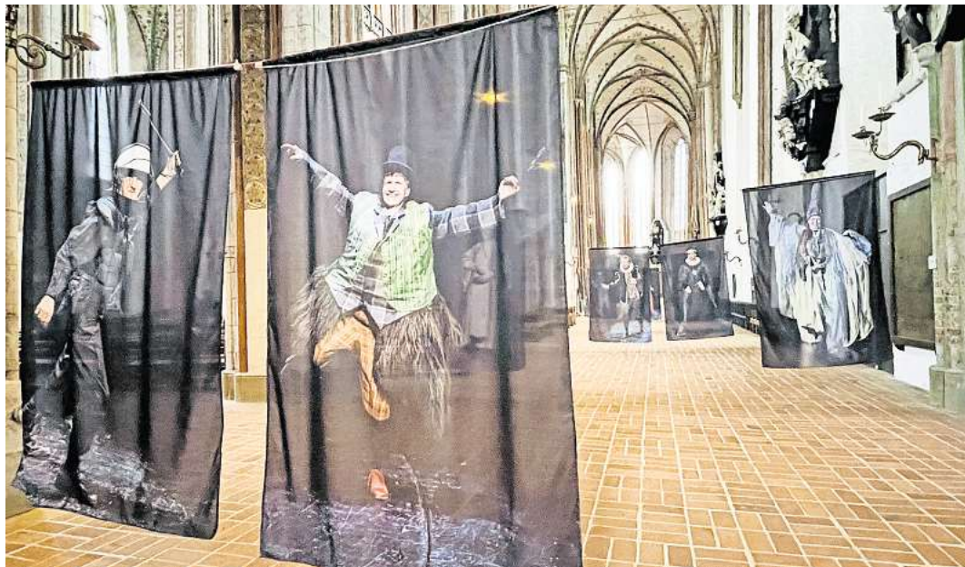
Sie schweben wie in einem Traum in der Marien-Kirche: Zehn Menschen, die für das Straßenmagazin „Hempels“ arbeiten, wurden von Fotograf Holger Förster im Theater Kiel abgelichtet.

„Die Fotos zeigen, wie sehr sich unser Blick oft auf Äußerlichkeiten konzentriert und wie