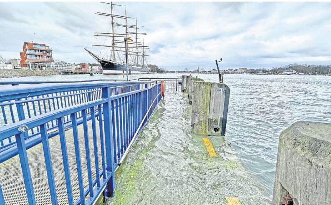
Mal sind es Naturgewalten wie auf unserem Foto, dann wieder liegt es an technischen Problemen: Immer mal wieder fällt die Personenfähre zwischen Travemünde und dem Priwall aus.