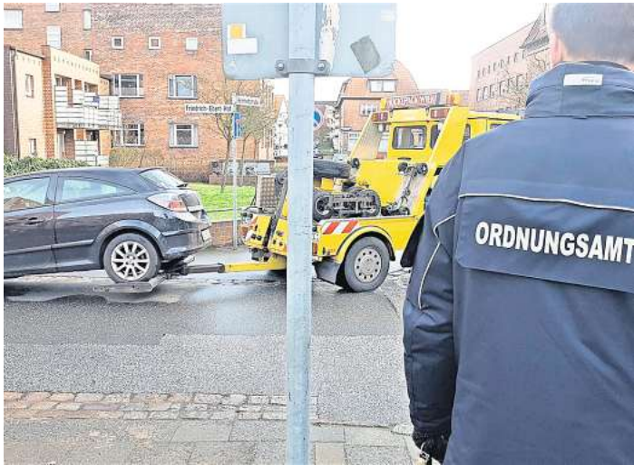
Die Stadt geht seit Monaten konsequent gegen Falschparker vor und ahndet das unerlaubte Parken auf Gehwegen.

Der Verkehrsclub ADAC kann die Dimension nicht einschätzen. Sprecher Rainer Pegla sagt aber: „Bisher geduldetes Parken auf Gehwegen wird konsequenter