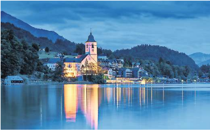
An den Feiertagen unterwegs: Der Wolfgangsee ist ein tolles Ausflugsziel in Österreich.

Für die Festtage hat der renommierte Veranstalter Reising Hamburg mit den knallroten Bussen einige neue Reiseziele im Gepäck: Windischgarsten in Oberösterreich punktet im Advent mit einem tollen familiengeführten Vier-Sterne-Hotel mit Sauna und Hallenbad sowie einem umfangreichen Ausflugsprogramm nach Linz, in die Steiermark und an den Wolfgangsee. Außerdem geht es über Weihnachten nach Borkum, nach Bad Boll auf der Schwäbischen Alb oder nach Lippstadt. Der Jahreswechsel kann sehr gediegen in Straßburg, in Dresden mit einem Neujahrskonzert in der Frauenkirche oder im Altmühltal gefeiert werden. Alle Reisen starten mit maximal 30 Gästen und Einzelplatzgarantie für Alleinreisende, wenn dies gewünscht wird. Und der Haus-