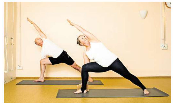
Neben regulären Yogakursen bietet die Asana-Praxis auch spezielle Formate für Schwangere, junge Mütter und Yogalehrende an.

Trotz der konzentrierten und präzisen Arbeitsweise,