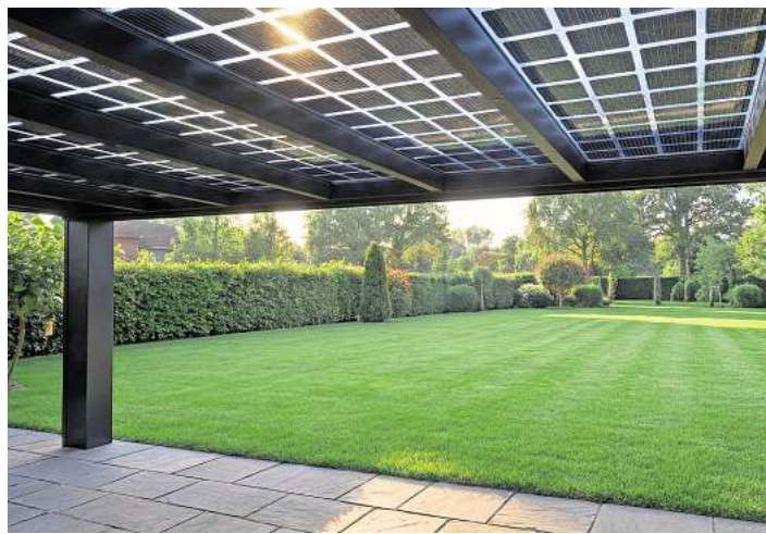
Das Kraftwerk im Garten: Die Überdachung „SolarCubeOne“ der Firma Sonnenliebe erzeugt auch Strom.