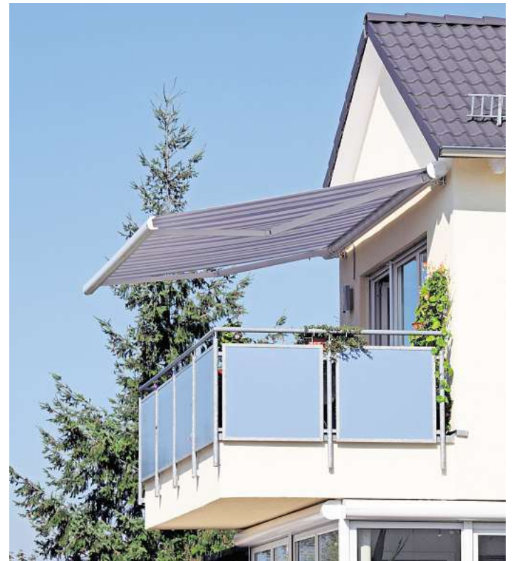
Die heißen Tage kommen noch. Am besten gelangt die Hitze erst gar nicht ins Haus.

Komfortabler wird es mit technischer Unterstützung: Sonnenschutzsysteme lassen sich oft mit Smart-Home-Anwendungen und Wetterstationen verbinden. Dann reagieren Markisen oder Rollläden automatisch auf Sonnenstand und Witterung. Das Haus bleibt auch geschützt, wenn niemand zu Hause ist. Darüber hinaus sind individuelle Einstellungen möglich.