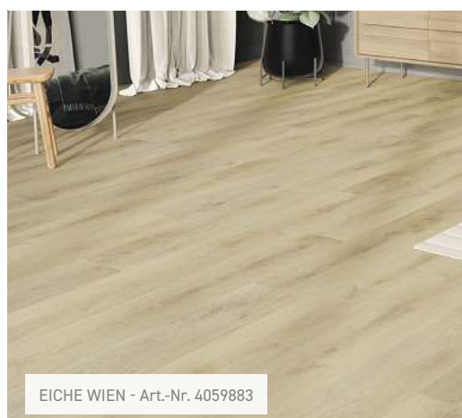
EICHE WIEN - Art.-Nr. 4059883