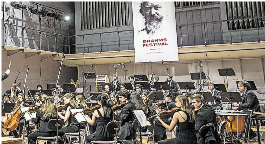
Das Sinfonieorchester der Musikhochschule Lübeck eröffnet das Brahms-Festival mit einem vielseitigen Programm unter der Leitung von Catherine Larsen-Maguire.

Das Festival bietet erneut ein breites Spektrum an Formaten: vom großen Sinfoniekonzert über zahlreiche Kammermusik- und Gesprächskonzerte bis hin zur Brahms Night Lounge. Rund 80 junge Musikerinnen und Musiker des MHL-Sinfonieorchesters er-