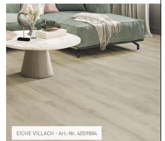
EICHE VILLACH - Art.-Nr. 4059884

KNUTZEN HOME Lübeck Osterweide 14 Telefon 0451 50 49 060