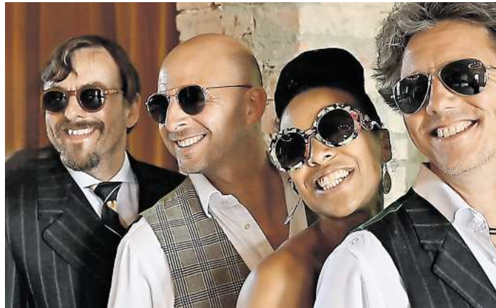
„Max & Friends“ eröffnen um 19 Uhr mit ihrem Auftritt im Rittersaal das Event. Sie sind nicht nur eine Band, sondern alle auch beste Freunde. Foto: Max & Friends

Neben dem kulturellen Anspruch steht seit Beginn auch der gute Zweck im Mittelpunkt. Der Förderverein des Lions Clubs Eutin nutzt das Event, um Spenden für soziale Projekte zu generieren. Konkrete Summen werden bewusst nicht in den Vordergrund gestellt, doch insgesamt trägt das „Schloss in den Mai“ seit Jahren erheblich zu den Charity-Aktivitäten des Clubs bei. Zusammen mit weiteren Aktionen wie dem Lions Charity Dinner, dem Weindorf beim Stadtfest oder der „Tröste-Teddy“-Initiative kommen jährlich rund 20.000 bis 25.000 Euro für gemeinnützige Zwecke zusammen.