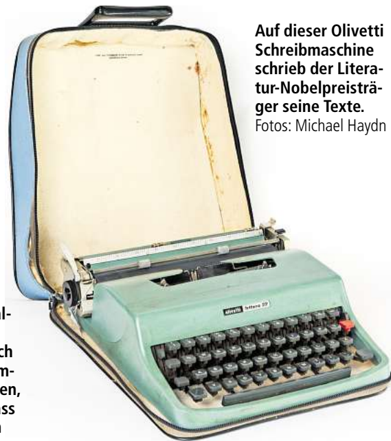
Auf dieser Olivetti Schreibmaschine schrieb der Literaturnobelpreisträger seine Texte.

schen. Ein Teil dieser wertvollen Objekte konnte nun nach Lübeck überführt werden. Die Gegenstände sollen ab 2027, dem Festjahr „100 Jahre Günter Grass“, dauerhaft im Günter Grass-Haus ausgestellt werden. Die Exponate wurden in den letzten Monaten digitalisiert, um damit die Möglichkeit zu bieten, das Werk von Günter Grass umfassend wissenschaftlich zu erforschen.