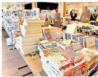
Im Ferien- und Freizeitpark Weissenhäuser Strand findet ein Indoor-Flohmarkt statt.

Angebot stillt großen und kleinen Hunger. Darüber hinaus steht am Samstag auch das Lichtermeer im Dünenbad unter dem Motto „Glanzmomente“ auf dem Programm. Gezeigt wird dabei der Kinofilm „Frühstück bei Tiffany“. Weitere Informationen unter www.weissenhaeuserstrand.de .