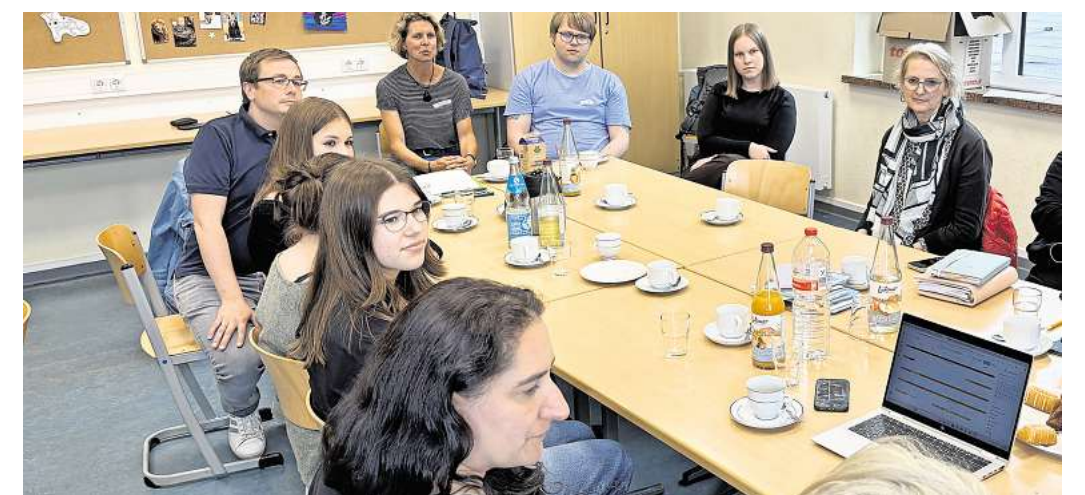
Regionaltreffen der Schulen ohne Rassismus in der Lensahner Berufsschule im Sommer 2025: Vier neue Mitglieder sind in diesem Jahr hinzugekommen.

Für 2026 steht eine Premiere an: Erstmals werden sich alle Netzwerk-Mitglieder an einer gemeinsamen Aktion beteiligen. Geplant ist sie für die zweite Märzhälfte, während der „Internationalen Wochen gegen Rassismus“. Die Feinabstimmung