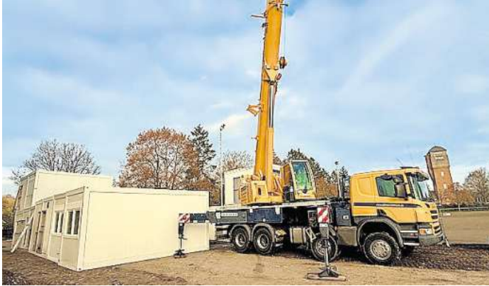
Die Container für die künftige Flüchtlingsunterkunft werden am Rand des Sportplatzes zwischengelagert.

MALENTE. Ein Schwerlastkran steht auf dem Sportplatz an der Ringstraße. Daneben hält ein Sattelschlepper. An Seil und Haken des ausgefahrenen Arms pendelt ein Container. Nach kurzer Luftfahrt landet die Metallkiste auf weiteren Containern. Die Wohnmodule, die als Flüchtlingsunterkünfte dienen sollen, werden derzeit am Rand der Feuerwehrezufahrt in Malente gestapelt.