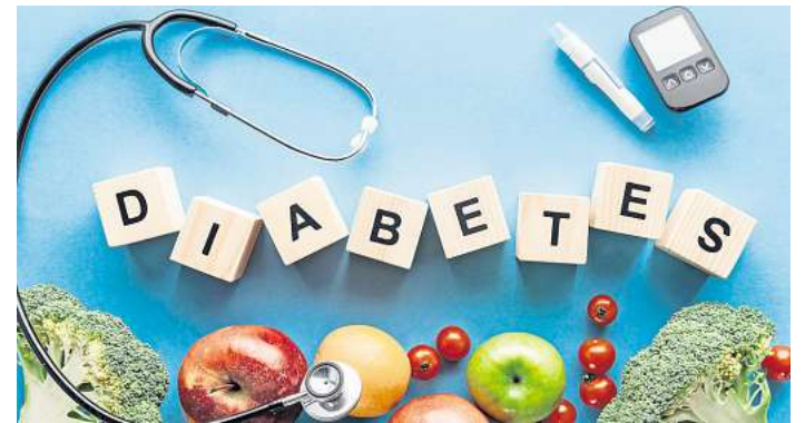
Betroffene müssen ihr Leben auf diese Krankheit einstellen.

Diabetes Typ 2 ist in der Regel eine durch einen ungesunden Lebensstil erworbene Erkrankung. Zu den Ursachen zählen nicht nur das Alter und erbliche Veranlagung, sondern auch Risikofaktoren wie Übergewicht, Bewegungsmangel,