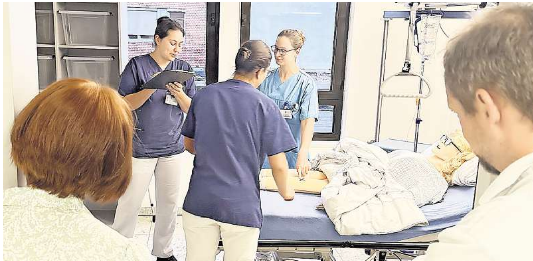
Im „Room of Error“ der Sana Kliniken Lübeck werden absichtlich Fehler eingebaut, die innerhalb von 15 Minuten gefunden werden müssen.

Bisher haben fünf Teams den „Room of Error“ kennengelernt, Ende des Jahres ist der nächste Durchlauf geplant. Ab 2026 gibt es dann vier Termine pro Jahr, an denen jeweils mehrere Teams trainiert werden, sagt Fromm-Lorenz.