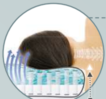
Genau auf Ihre Schulterhöhe angepasst – das Original Orthopädische Gesundheitskissen für XS – XXL Schultern