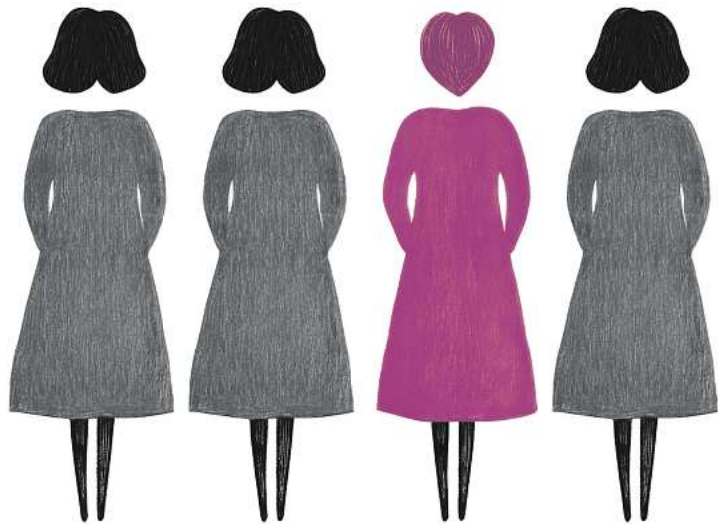
3 von 4 Frauen hatten schon vermindertes Verlangen*