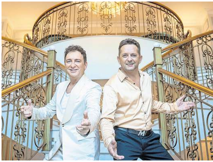
Das Duo Fantasy gastiert in der Lübecker MuK.