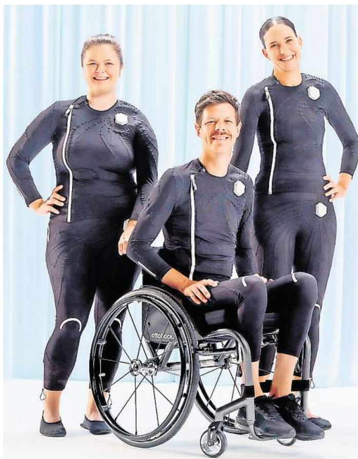
Zurück zur Bewegung – mit der neuen Generation des exopulse suit.