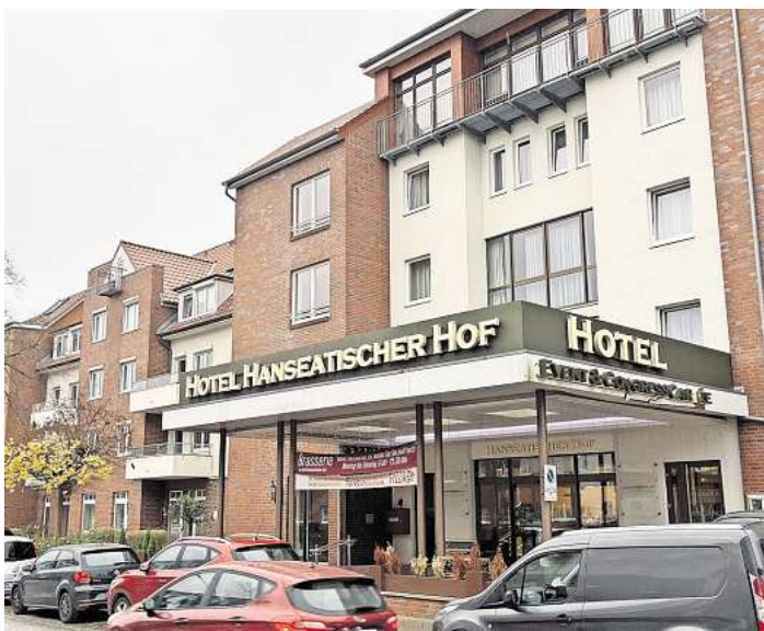
In dem Gebäude sollen Wohnungen entstehen.

Einzelheiten sind gerade bekannt geworden. „Im Zuge des