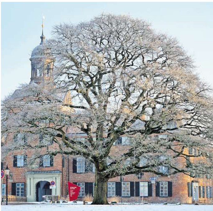
Das Schloss Eutin ist im Winter innen wie außen sehenswert.

27. Januar – 28. Februar 2025 geschlossen