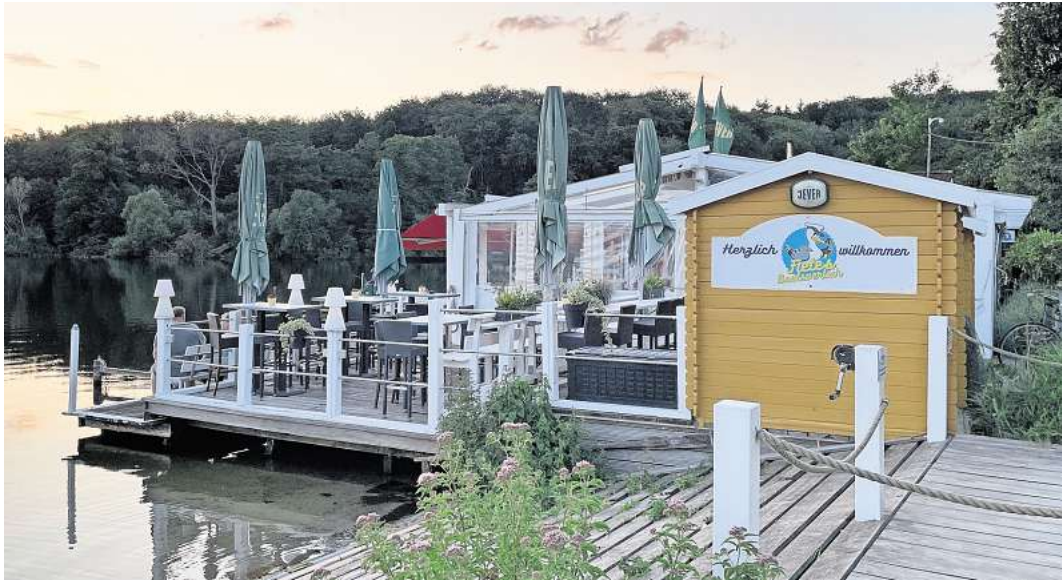
Idylle am See: Das Bootshaus Malente schließt Ende Oktober.

EUTIN. Zum „Medien-Samstag“ für Kinder lädt die Kreisbibliothek Eutin am Schlossplatz am 10. August um 11 Uhr alle Kinder bis 6 Jahre ein. Es wird ein Überraschungs-Bilderbuchkino gezeigt und vorgelesen. Der Eintritt ist frei.