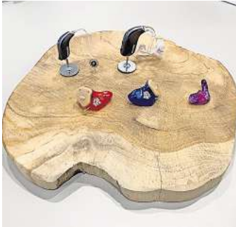
Die Vielfalt der Hörgeräte.

logie: Der Kunde entscheidet, was zu ihm passt, und die geschulten Mitarbeiter von Schmelzer helfen ihm dabei, das herauszufinden. Mit 4 Jahren Garantie, 3 Jahre 50 % Verlustschutz und einer Bestpreis-Garantie bietet das Familienunternehmen ein Rundum-Sorglos-Paket. Testen Sie die Hörsysteme einfach in Ihrem Alltag zu Hause, beim Sport oder Spaziergehen, beim Einkaufen, beim Schnack mit dem