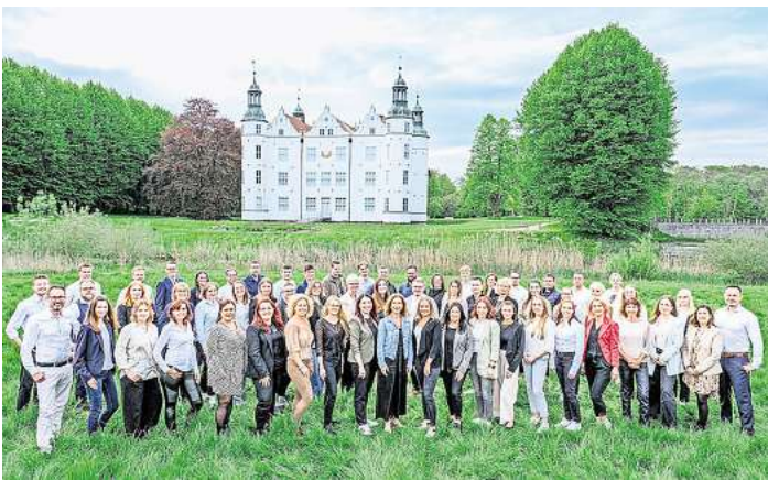
Das Team von Schmelzer Hörsysteme wächst von Jahr zu Jahr.

„Nach den Schulungen wurde das Event genutzt, um ein aktuelles Mitarbeiterfoto von Schmelzer Hörsysteme und Schmelzer Marketing zu machen. Fast 60 der mittlerweile 70 Mitarbeiter versammelten sich vor dem